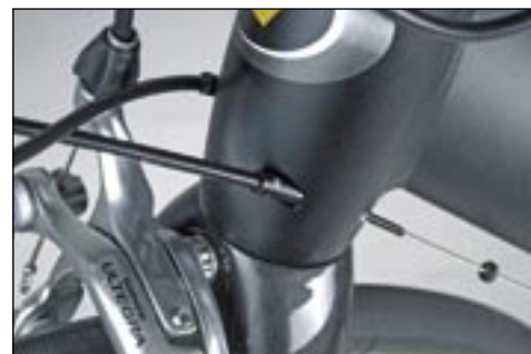
Kein Scheuern und kein Kratzen. Roy Hinnen verlegt die Züge durch das Steuerrohr.

dem Motto „black is beautiful“ tritt das T1 ganz in Schwarz an den Start. Auf übertrieben aerodynamische Rohrformen wurde verzichtet. Einzig das Unterrohr mit einer Dreiecksform und das aerodynamische Sitzrohr deuten am Rahmen selbst auf Zeitfahrqualitäten hin. Zwei schöne Features sind die Zugführung durch das Steuerrohr und extrem voluminöse Ausfallenden. Zudem wurde dem Rahmen eine Harteloxierung verpasst. Das bietet nicht nur optimalen Schutz, sondern schafft zudem optische Eleganz.