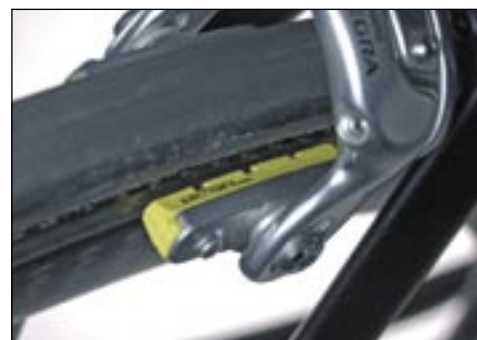
Spezielle Belege helfen dem Bremskörper bei der Arbeit auf Carbonfelgen.

Komplett in Shimano Ultegra gehüllt, zeigt sich das T1 gut ausgerüstet. Die gesparten Euro gegenüber einer Dura Ace wurden in hochwertige Syntace Anbauteile gesteckt, eine gute Entscheidung. Als einziger Hersteller des Tests setzt Roy Hinnen auf eine herkömmliche Brems/Schalthebelkombination und gewinnt so mit Blick auf den Schaltkomfort deutlich den Wettbewerb. Direkt unter den Hebeln haben die Schweizer den hochwertigen Syntace Lenker einfach „abgesäbelt“, das spart minimal Gewicht und passt optisch gut zu einem Triathlonrad. Ebenfalls alleine im Testfeld steht Hinnen mit seiner Entscheidung, eine gebogene Gabel einzusetzen; der so erhöhte Fahrkomfort hat uns gut gefallen. Das trifft auch auf den Einsatz von speziellen Carbonbremsgummis zu, die auch bei Nässe zupacken können.