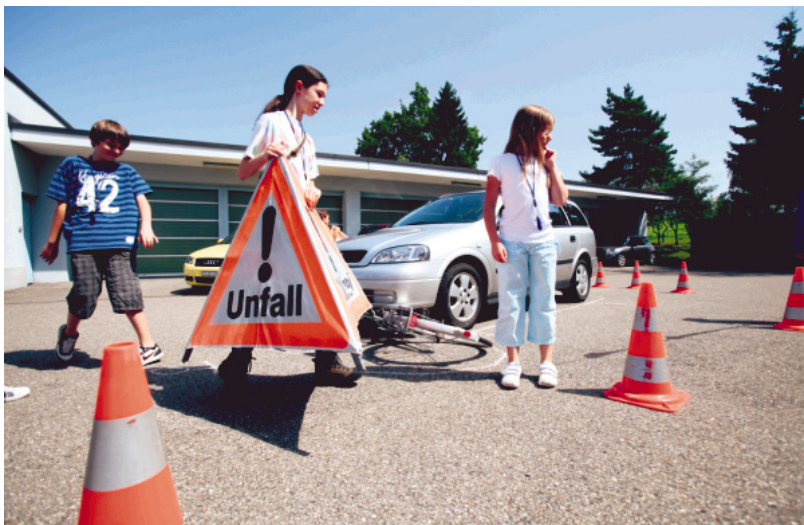
Die Unfallstelle ist gekennzeichnet - was nun? «Notarzt rufen!» Aber wo ist der Verletzte?

Hütten. - Die Primarschule Hütten hat seit Jahren Bedarf an zusätzlichen Räumen. Die Schulpflege hat nun eine Lösung gefunden.