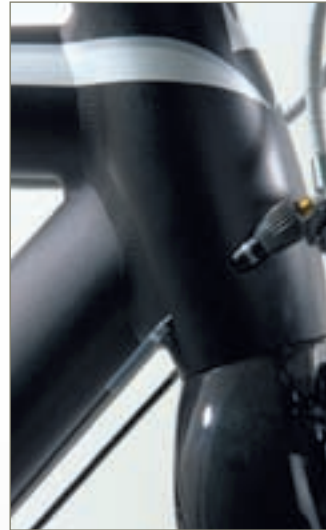
Durchbruch: Die Schaltzüge werden durch das Steuerrohr geführt